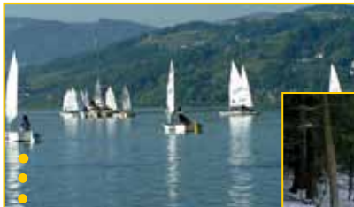
● Regaty na Jeziorze Rożnowskim ● (Gmina Łososina Dolna)