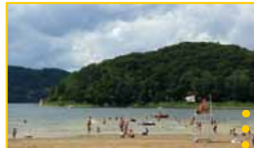
● Wypoczynek nad Jeziorem Rożnowskim ● (Gmina Gródek nad Dunajcem)