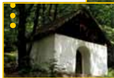
● Pustelnia ● św. Urbana ● (Gmina Iwkowa)