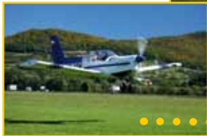
● Lotnisko Aeroklubu ● Podhalańskiego ● (Gmina Łososina Dolna)