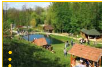
● Stawy rybne przy młynie w Żmięcej ● (Gmina Laskowa)