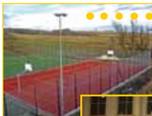
● Kompleks sportowy ● „Moje boisko – ORLIK 2012 ● (Gmina Lipnica Murowana)