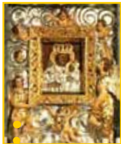
● Obraz Matki Boskiej ● Gosprzydowskiej ● (Gmina Gnojnik)