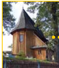
Kościół pw. Nawiedzenia NMP (Gmina Laskowa)