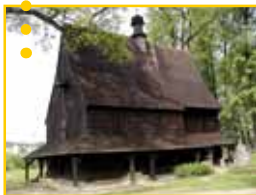
Kościół pw. Narodzenia NMP w Czchowie (Gmina Czchów)