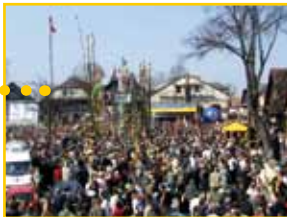
Konkurs Palm Wielkanocnych i Rękodzieła Artystycznego (Gmina Lipnica Murowana)