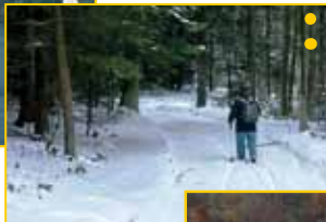
● Turystyczne szlaki ● na nartach śladowych ● (Gmina Iwkowa)