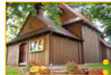
Kościół św. Justa pw. Narodzenia NMP w Łęgorozu (Gmina Łososina Dolna)