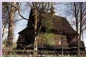
Gmina Gnojnik www.gnojnik.pl