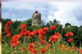
Gmina Czychów www.czychow.pl