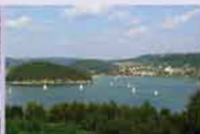
Gmina Gródek nad Dunajcem www.grodek.sacz.pl