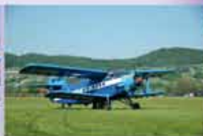
Gmina Łososina Dolna www.lososina.pl