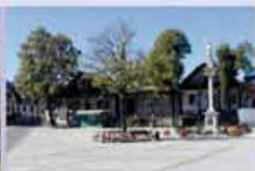
Gmina Lipnica Murowana www.lipnicamurowana.pl