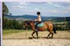
Gmina Iwkowa www.iwkowa.pl