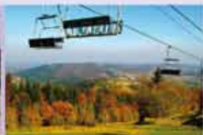
Gmina Laskowa www.laskowa.pl